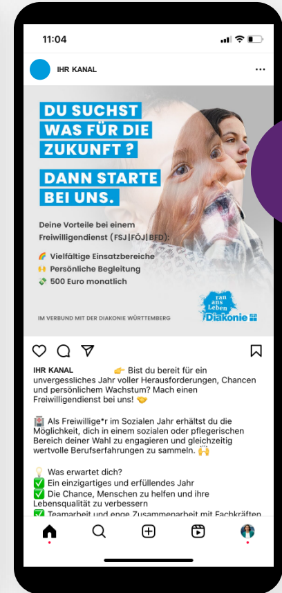
Post auf ihrem Kanal