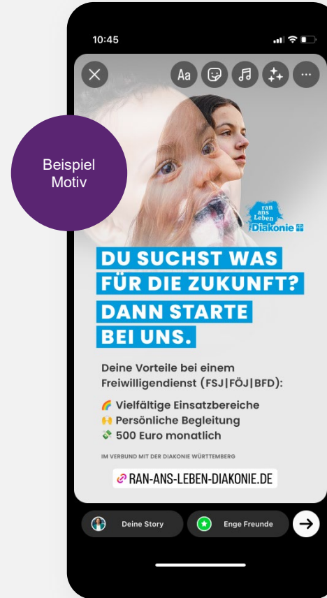
Post in ihrer Story

https://ran-ans-leben-diakonie.de/perspektive/